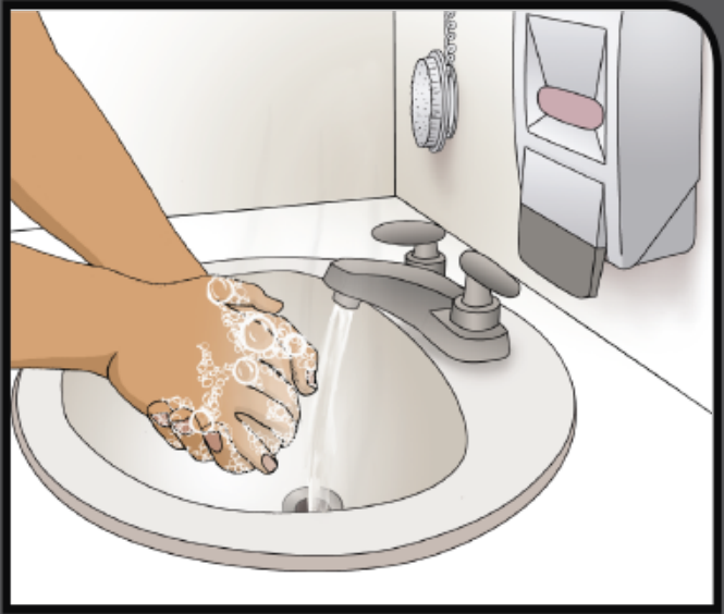
Wash and scrub for 20 seconds Frote sus manos por 20 segundos