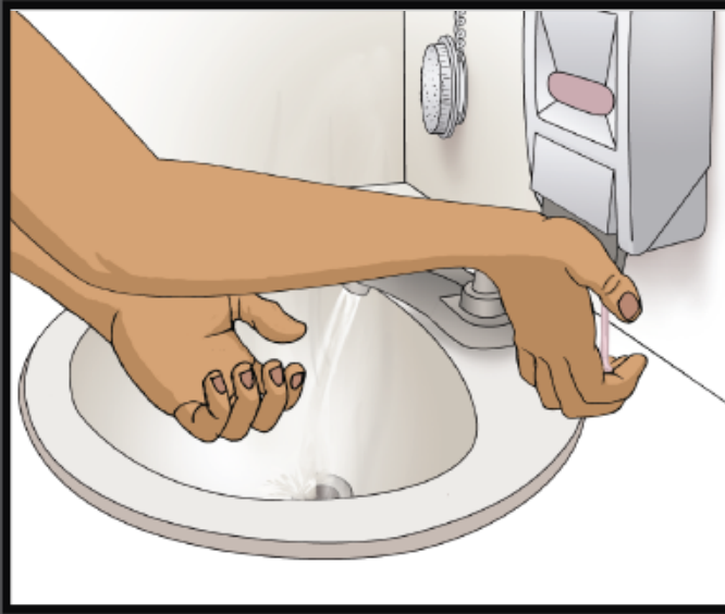
Use soap Use jabón