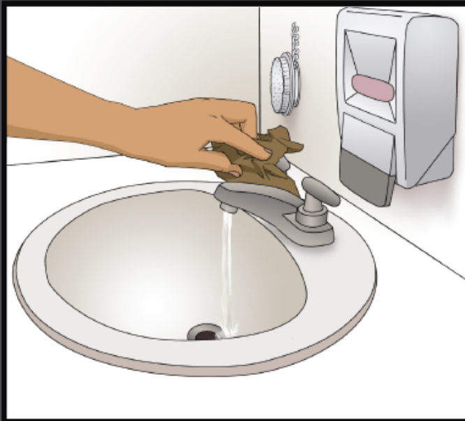
Turn off water with paper towel Cierre la llave del agua usando una toalla de papel