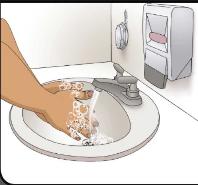
Rinse off soap Enjuague