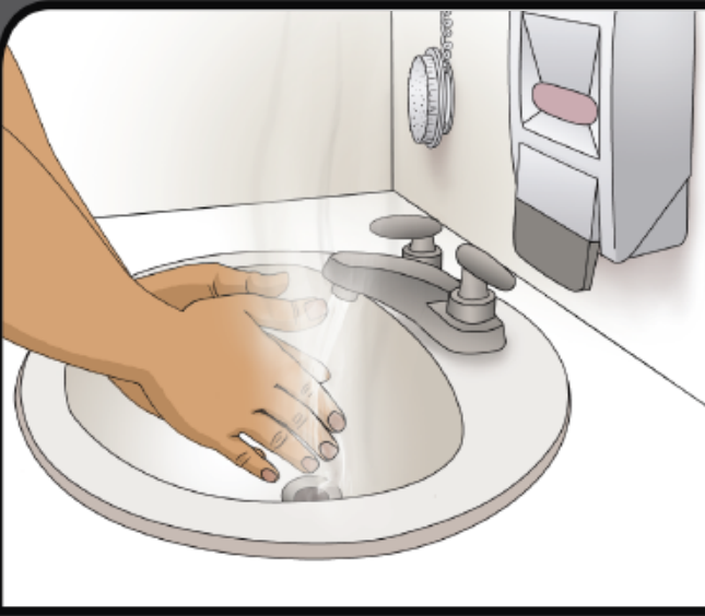
Wet hands with hot water Moje sus manos con agua caliente